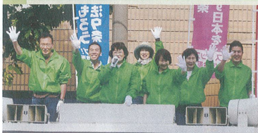
市内全区をまわり訴える共産党市議団

安保法制＝戦争法・共謀罪法の強行と加計学園など国政私物化、そして9条改憲への暴走…。