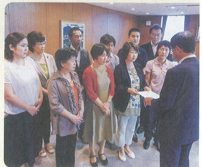
申し入れを行う住民と市議団

構造的な欠陥が指摘され、墜落事故をくり返すオスプレイに対し、住民に不安と反対の声がひろがりました。共産党は住民と共に日米共同訓練に抗議し、オスプレイの訓練と飛行の中止を求め秋元市長に申し入れを行いました。